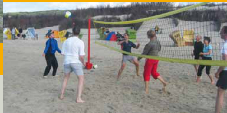
Beachvolleyball auf Langeoog