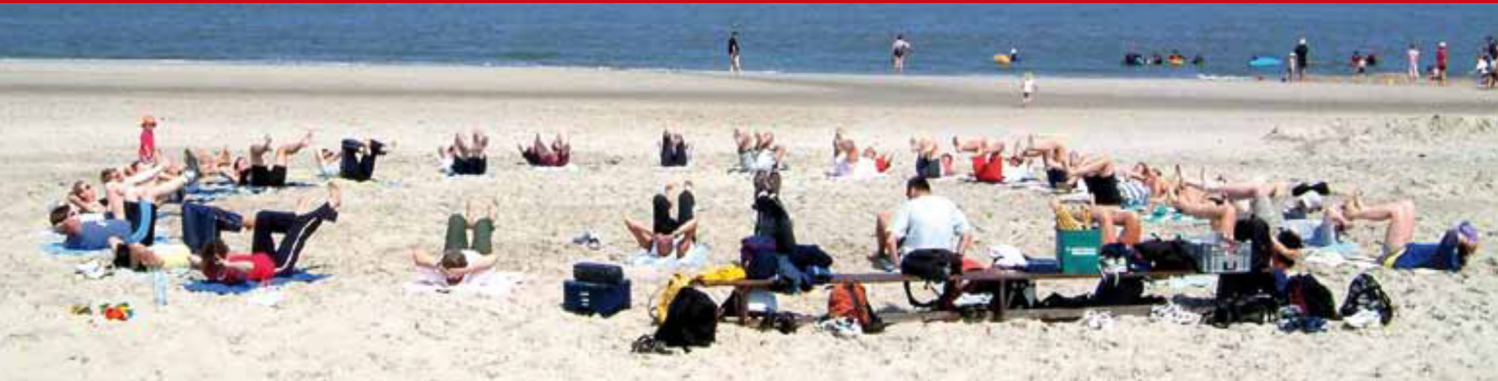
Gymnastik am Strand auf Langeoog