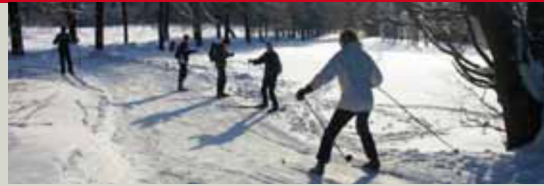
Skilanglauf in Bad Lauterberg