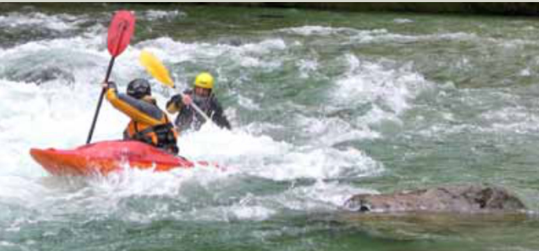
Wildwasserkanu in Wildalpen/Steiermark